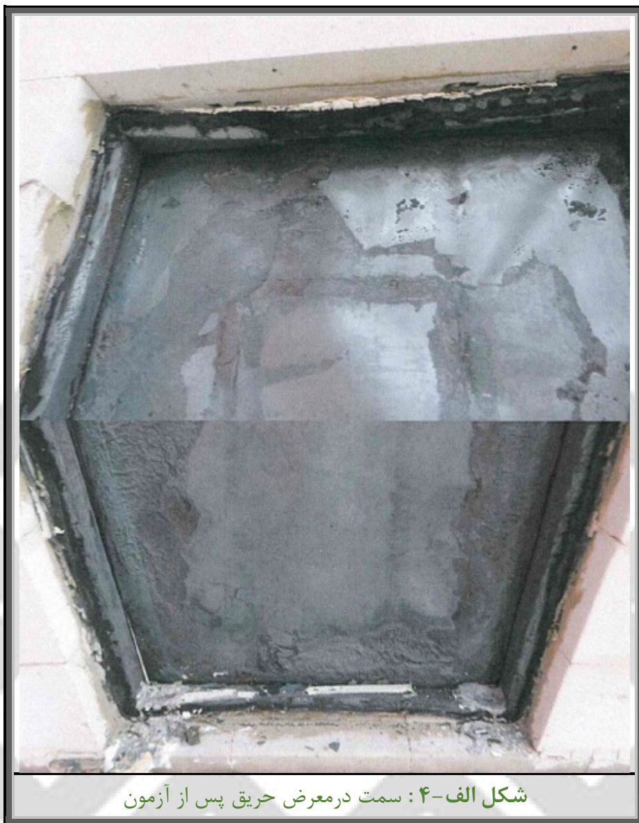
شکل الف-۴: سمت در معرض حریق پس از آزمون