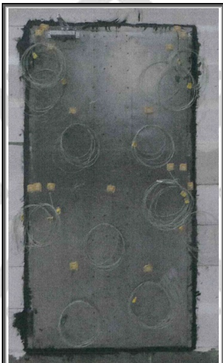
شکل الف-۱: سمت غیردر معرض حریق قبل از آزمون