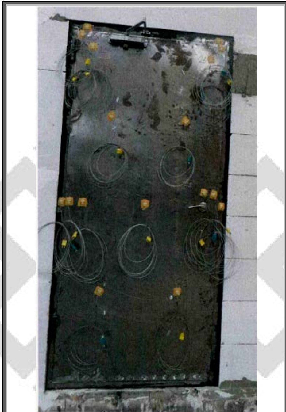
شکل الف-۱: سمت غیر در معرض حریق قبل از آزمون