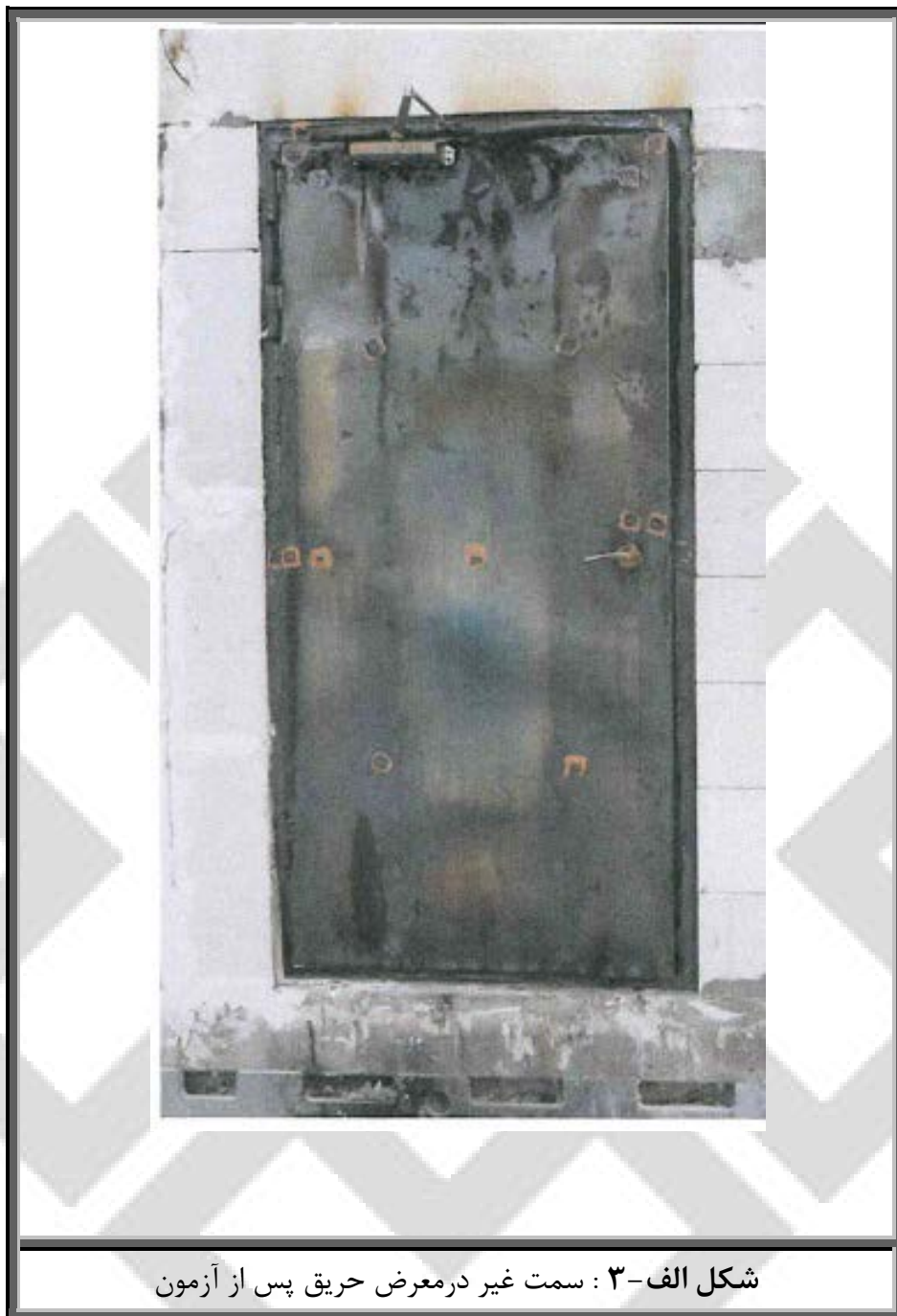
شکل الف-۳ : سمت غیر در معرض حریق پس از آزمون