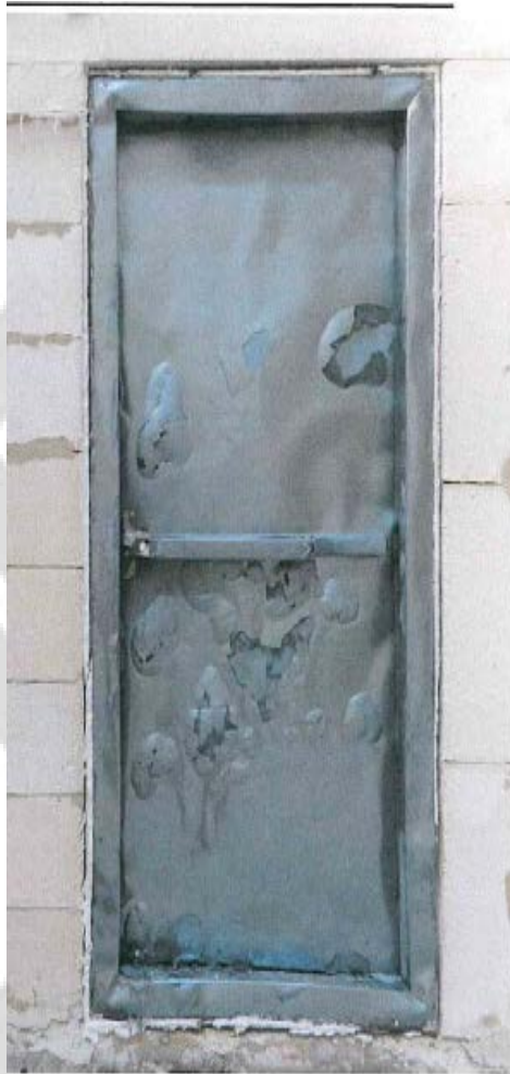
شکل الف ۴: سمت در معرض حریق پس از آزمون